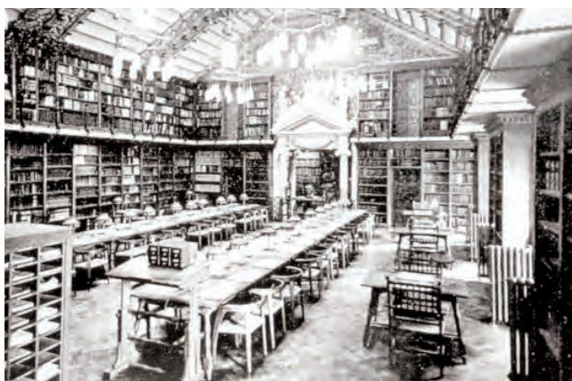
Sala de lectura de la Biblioteca de Catalunya