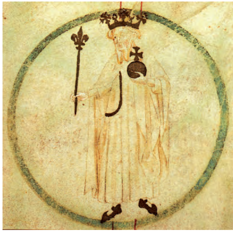
Jaume I en una miniatura del Rotlo de Poblet

Per tal de difondre el coneixement de la història dins de la societat, la Secció organitzarà actes amb motiu d'algunes commemoracions. La primera és el VIII Centenari del Naixement de Jaume I, que celebrarem el 2008 amb l'Any Jaume I, amb un congrés dividit en diverses seccions que se celebrarà en diferents seus a Catalunya, al País Valencià i a Mallorca. Jaume I és el rei conqueridor dels regnes de València i de Mallorca, és qui donà una empenta decisiva a l'organització dels municipis i de moltes altres institucions i qui afavorí l'expansió del comerç i de la marina catalans, i mereix una commemoració especial.