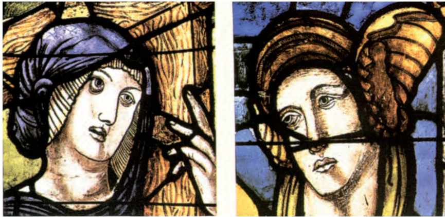
Els vitralls del monestir de Santes Creus i la catedral de Tarragona a la col·lecció «Corpus Vitrearum Medii Aevi»