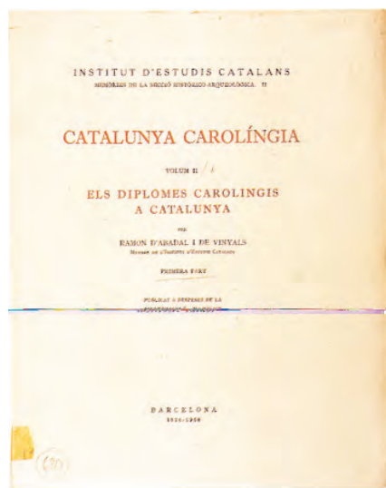
Coberta de la Catalunya carolíngia

Unes altres publicacions iniciades en aquesta època foren l' Epistolari de M. Milà i Fontanals , a cura de Nicolau d'Olwer; sortí el primer volum el 1922, el segon el 1932 i el tercer el 1995. També s'inicià l'edició de l'obra de Constantin Marinescu, interrompuda per la Guerra, La politique orientale d'Alphonse V d'Aragon, roi de Naples ; els plecs impresos, corresponents més o menys a les dues terceres parts de l'obra, els vàrem publicar l'any 1994.